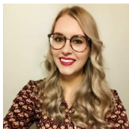
Penningmeester Even voorstellen

Bij deze wil ik jullie laten weten dat ik per 9 april de nieuwe penningmeester ben van de fanfare. Ik ben bijna 24 jaar en zelf ben ik ondertussen 16 jaar lid van de vereniging en ben sinds 2019 bestuurslid. In het korps speel ik al heel wat jaren sopraan saxofoon.